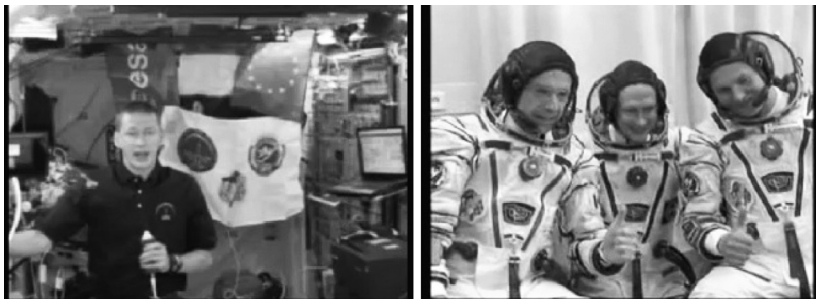
Ilustracja 3. Kadry ze spotu z udziałem astronauty Franka de Winne z 2009 roku

zwizualizowany i zamieszczony w Internecie (ilustracja 3). W krótkiej odezwie internauta przekonywał dlaczego warto wziąć udział w wyborach i jak wiele Europejczycy mogą osiągnąć współpracując.