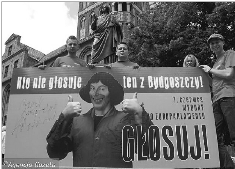
Ilustracja 2. Plakat Fundacji Kopernikańskiej z Torunia – kampania profrekwencyjna 2009